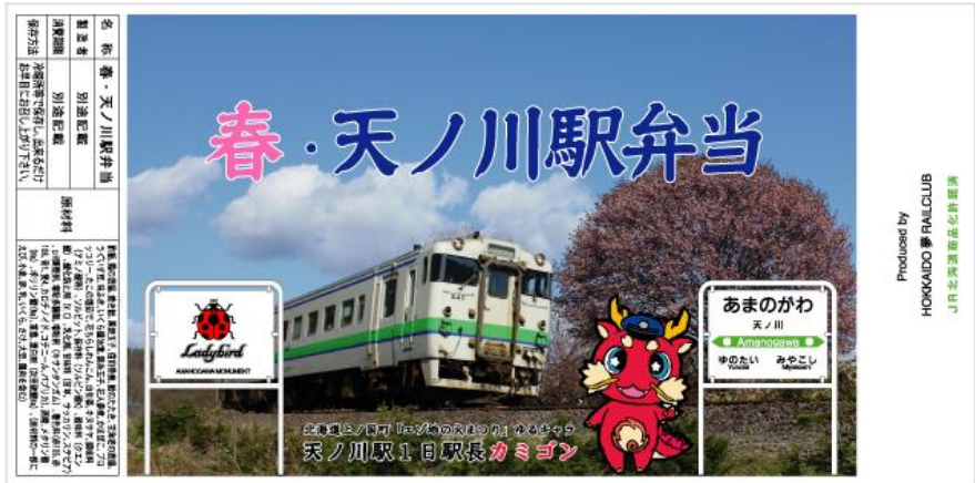
『春・天ノ川駅弁当』（JR北海道商品化許諾済）掛紙のイメージ